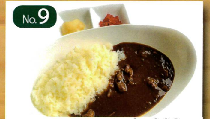
No.9 ビーフカレー 1,000円 (税抜 910円) 福神漬け・らっきょう付き 差額+0円