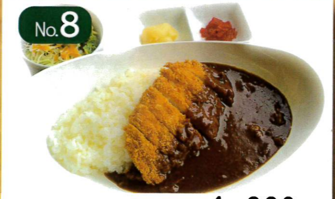
No.8 カツカレー 1,320円 (税抜 1,200円) サラダ・福神漬け・らっきょう付き 差額+320円