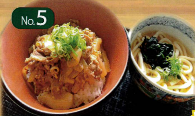
No.5 牛カルビ丼セット 1,320円 (税抜 1,200円) ミニうどん付き 差額+320円

メニュー番号をスタッフに お申し付け下さい。 ミニうどん ↓ 通常うどんに ご変更 税込+220円 (税抜 200円) Himeji Aioi C.C