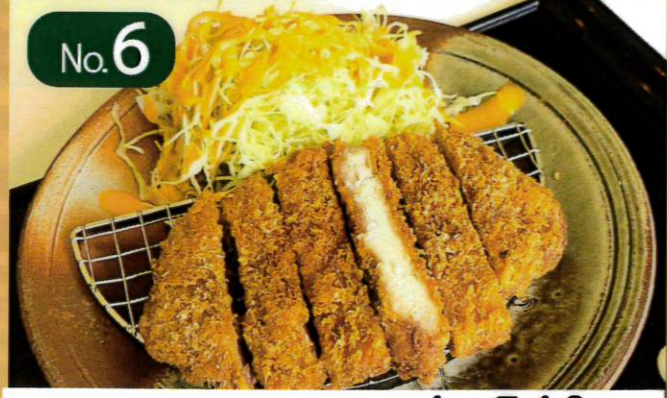
No.6 とんかつ定食 1,540円 (税抜 1,400円) ライス・味噌汁付き 差額+540円

メニュー番号をスタッフに お申し付け下さい。 ミニうどん ↓ 通常うどんに ご変更 税込+220円 (税抜 200円) Himeji Aioi C.C