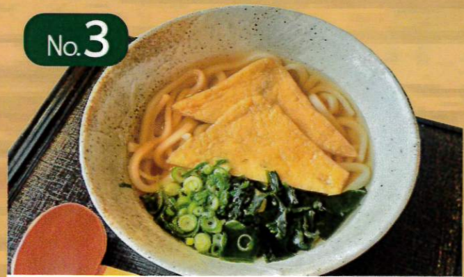
No.3 きつねうどん 1,000円 (税抜 910円) 麺大盛 +200円 差額+0円