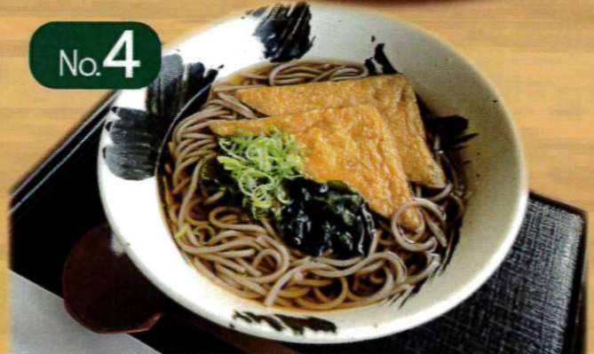
No.4 きつね蕎麦 1,000円 (税抜 910円) 麺大盛 +200円 差額+0円